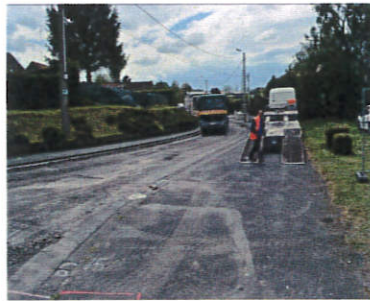
Réfection de la Rue du 158 ème RI