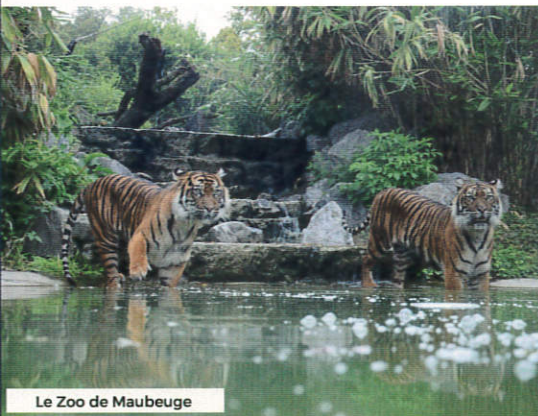
Le Zoo de Maubeuge