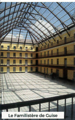
Le Familistère de Guise